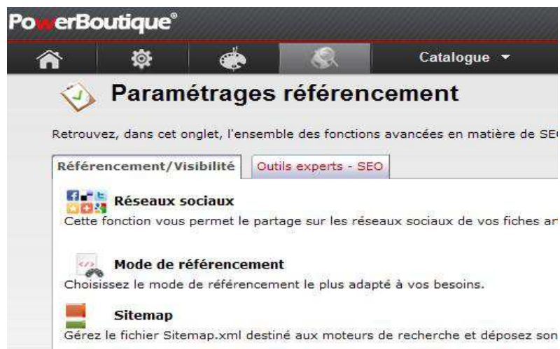
Figure 1 Les modes de référencement

Nous proposons différents niveaux de référencement qui vous permettent de choisir le degré de personnalisation de ces balises. Ce paramétrage s'effectue dans la fonction "Mode de référencement" de la rubrique "Référencement"